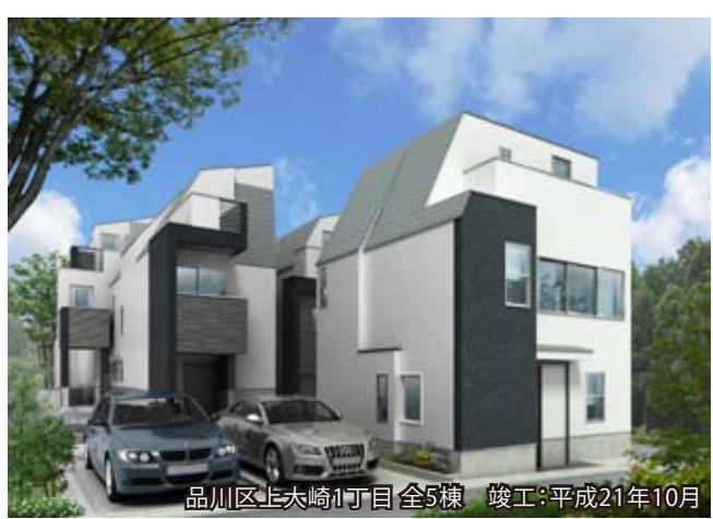
品川区上大崎1丁目 全5棟 竣工:平成21年10月