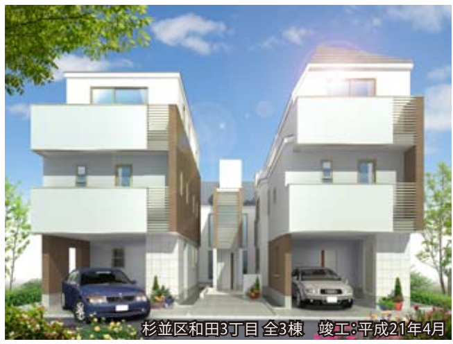
杉並区和田3丁目 全3棟 竣工:平成21年4月