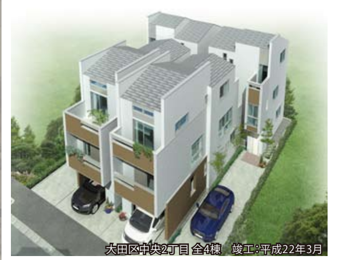
大田区中央2丁目 全4棟 竣工:平成22年3月