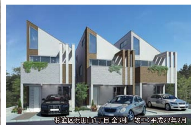
杉並区浜田山1丁目 全3棟 竣工:平成22年2月